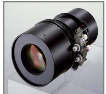
4. Tele-Zoom II